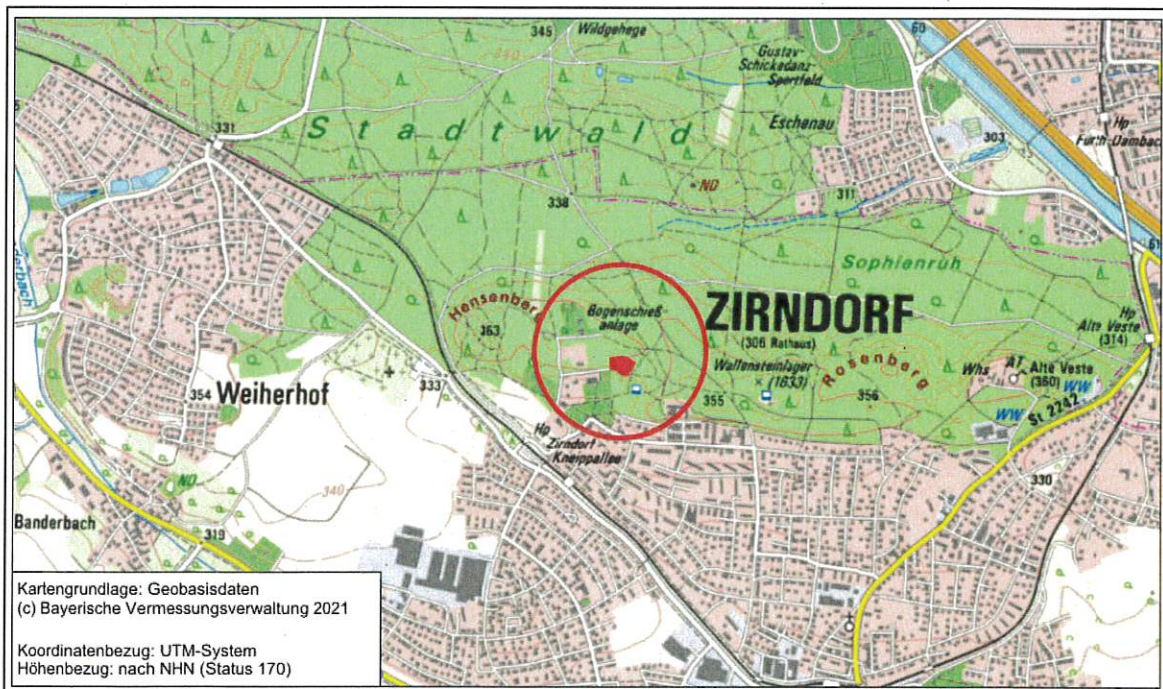
Übersichtskarte mit Kennzeichnung Geltungsbereich (rot markierte Fläche)

Das Plangebiet ist wie folgt im Stadtgebiet verortet: